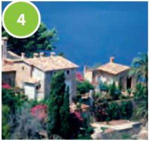
4 a villa