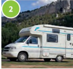
2 a camper van