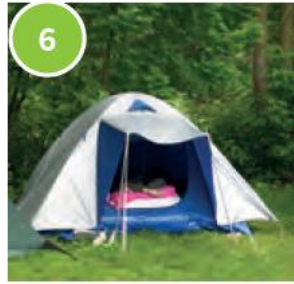
6 a tent