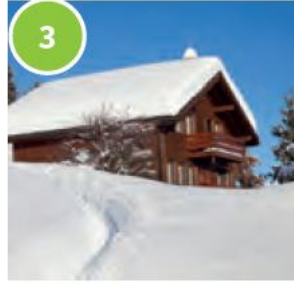
3 a chalet