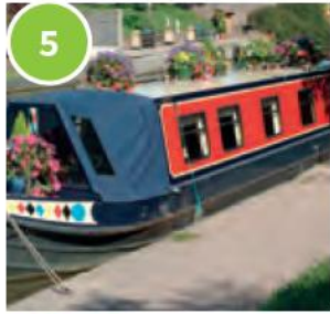
5 a barge