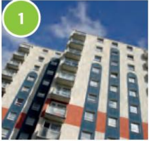
1 a block of flats

a barge a villa a chalet a block of flats a camper van a tent